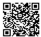
認識院系 心理師/社工師 貼心 QR Code

♥ 諮商輔導中心與原資中心合作，自106學年度起提供原住民族學生專屬社工師/心理師，歡迎預約！