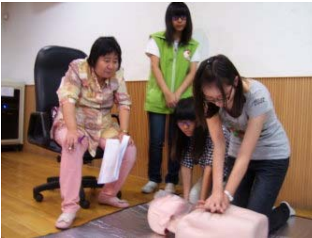
心肺復甦術技術測驗