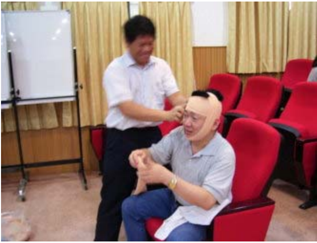
基本創傷救命術技術練習