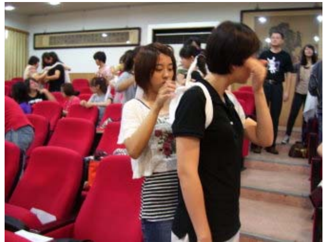
基本創傷救命術技術測驗