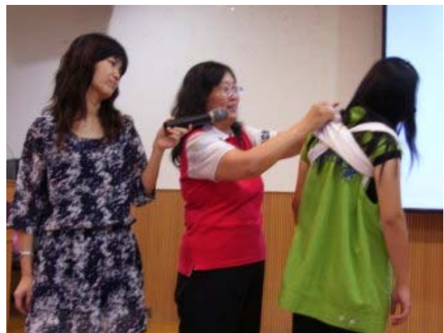
基本創傷救命術技術示教