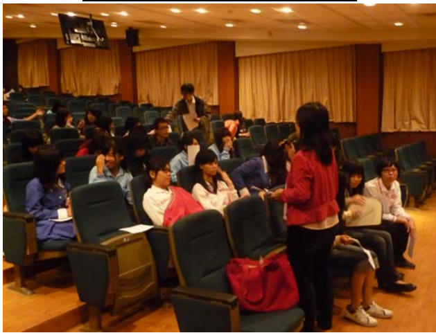
影片導覽及有獎徵答