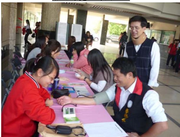
「生命關懷週」及「情緒健檢-關懷自己系列」活動