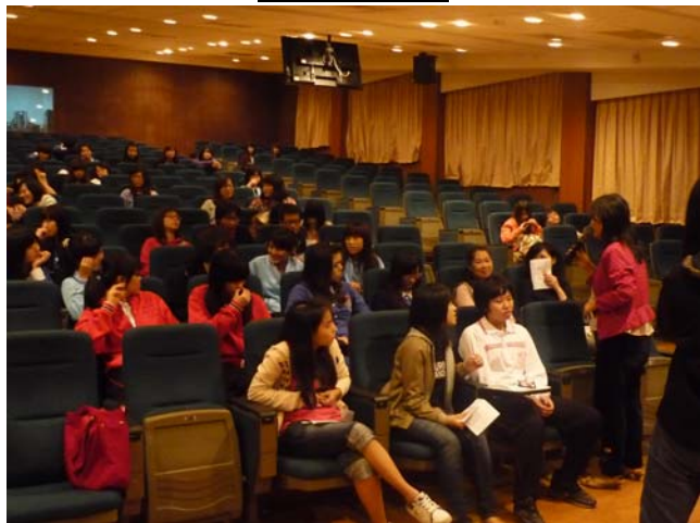
影片導覽及有獎徵答