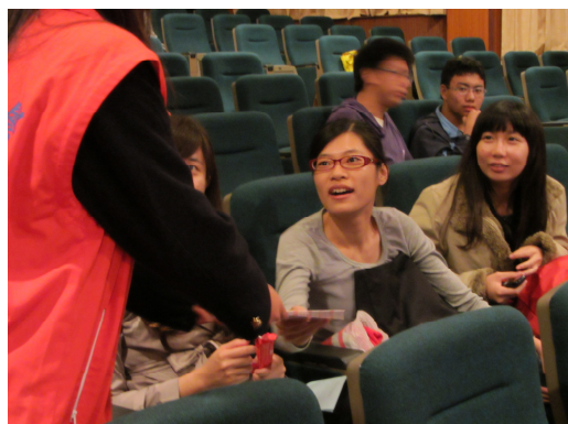
學生回答有獎徵答題目