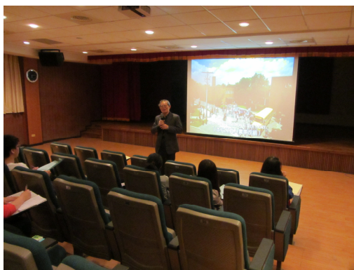
影片播放後之導覽與討論