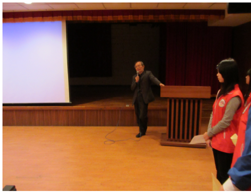
帶領老師播放影片前之導覽