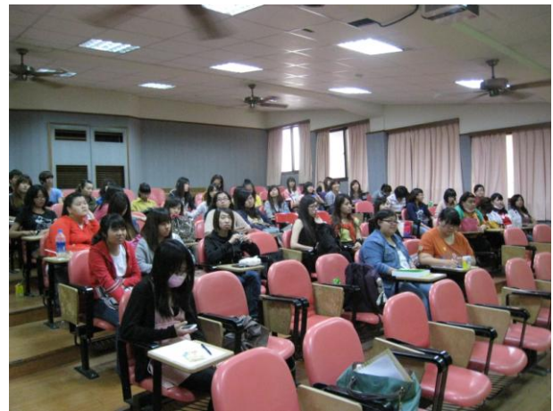
學生們專心聆聽演講