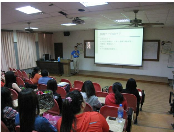
學生們專心聆聽演講