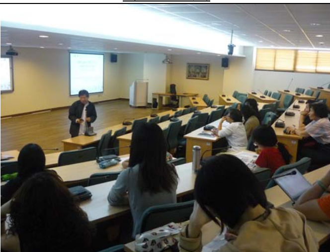
與會老師認真聽講