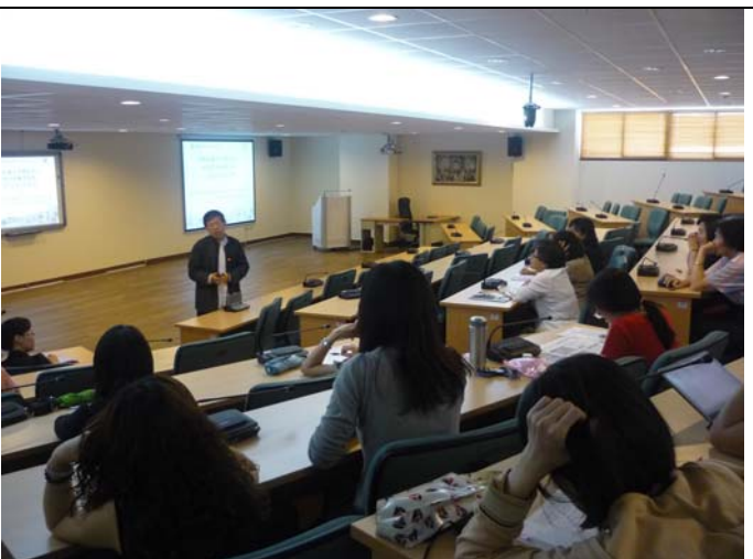
與會老師認真聽講