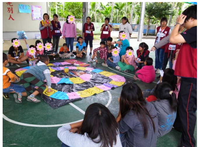
12月9日大富翁團體遊戲