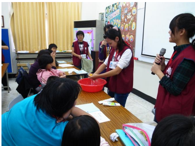
12月9日教導學童正確洗臉