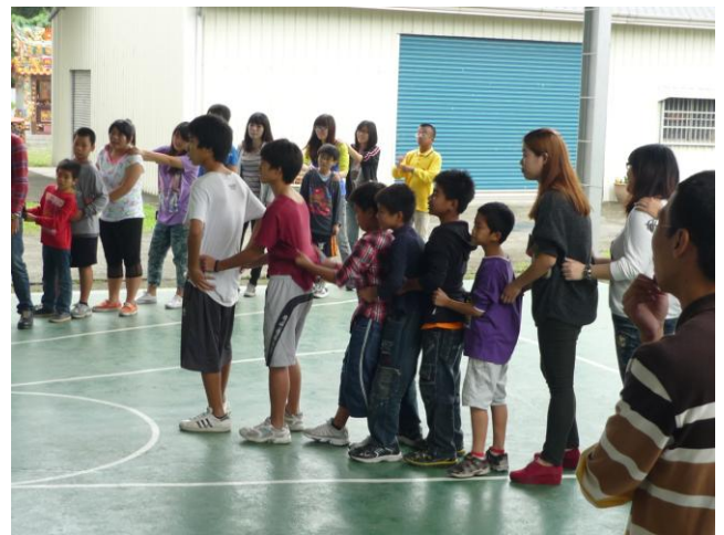
11月18日團康活動老鷹抓小雞