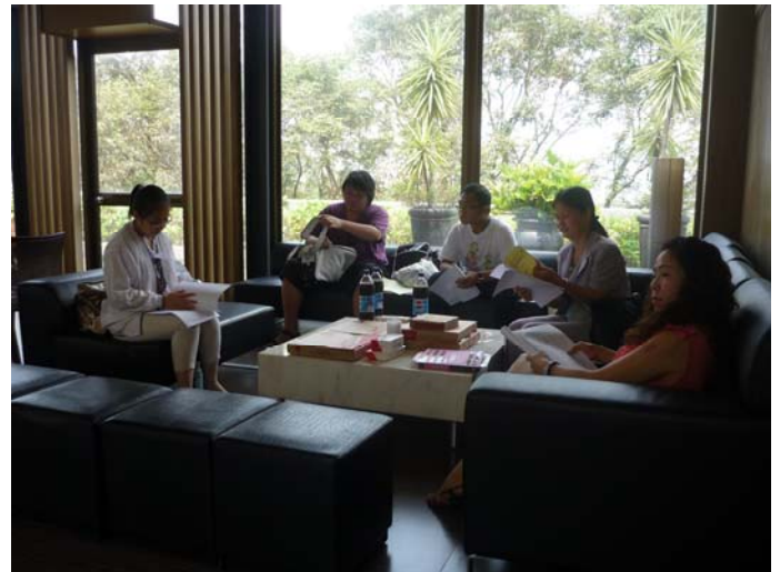
學生與輔導老師相互交流