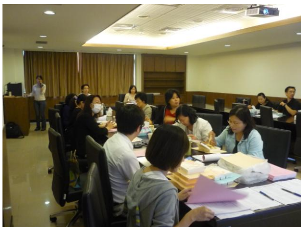
資源教室輔導員報告