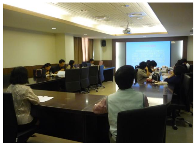
介紹資源教室成立緣起及各項服務內容