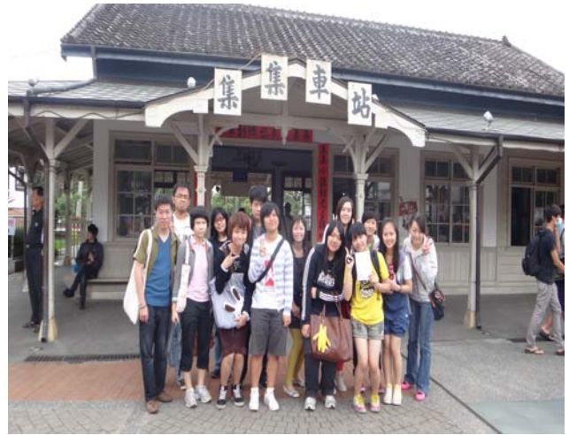
集集火車站一大合照