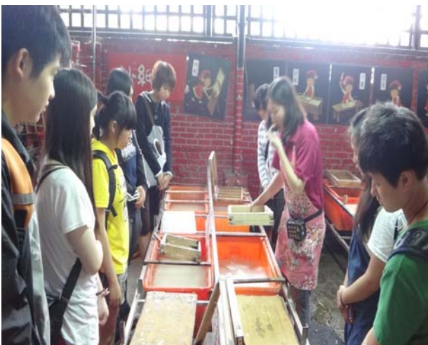
廣興紙寮—造紙體驗活動