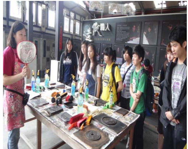
廣興紙寮—導覽老師介紹紙扇拓印