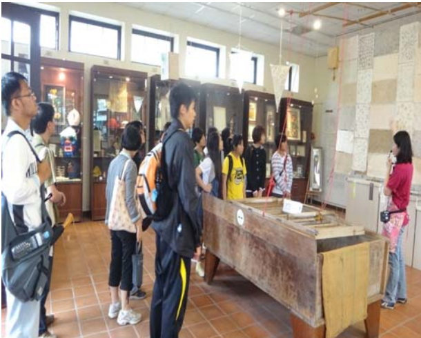
廣興紙寮—導覽老師介紹手工紙