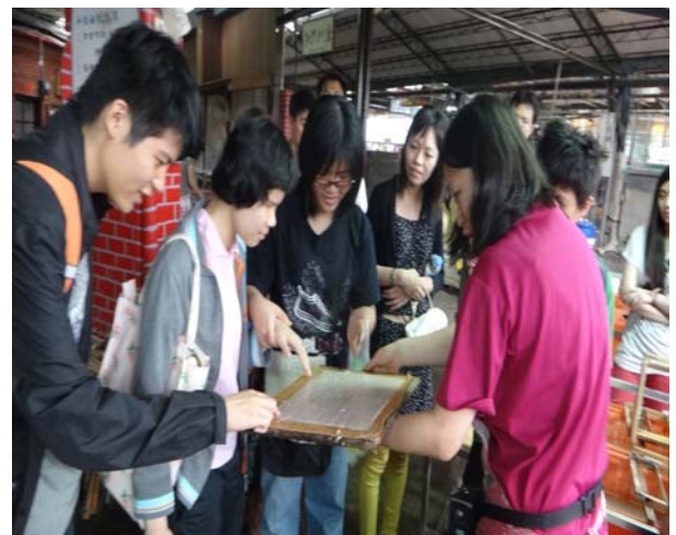
廣興紙寮—造紙完成，大家一起摸摸看