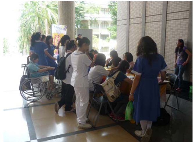
學生踴躍參與情緒自我健檢 (三)