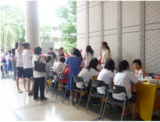
學生踴躍參與情緒自我健檢 (二)