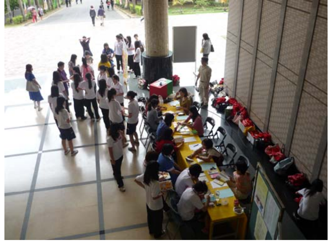
學生踴躍參與情緒自我健檢 (一)