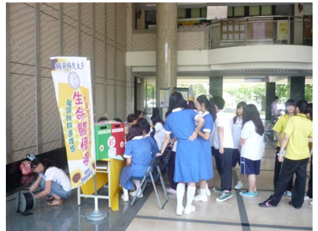
學生踴躍參與情緒自我健檢 (五)