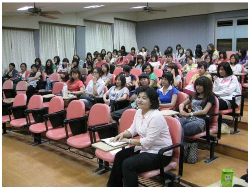
同學們專注的聆聽