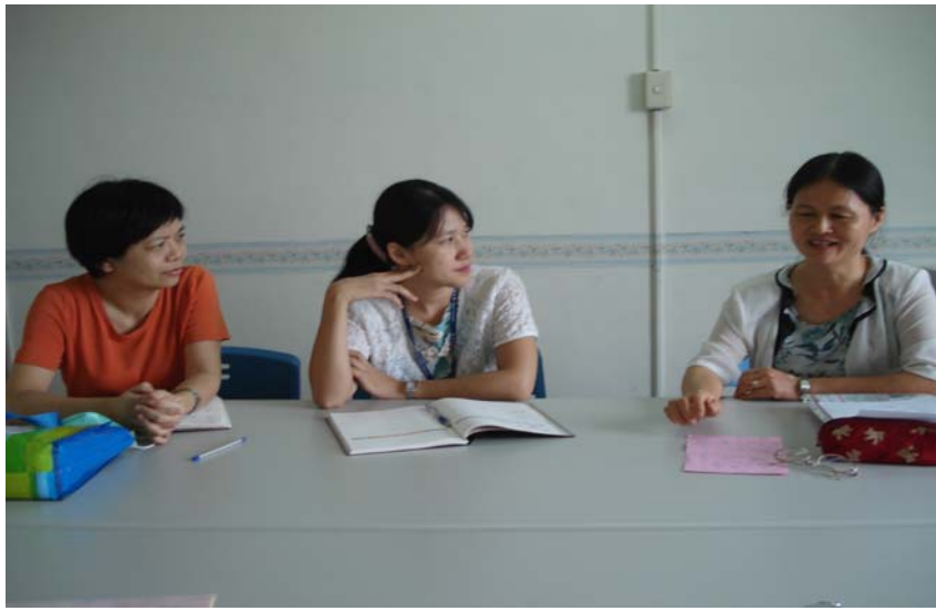
老照、長照-導師研討