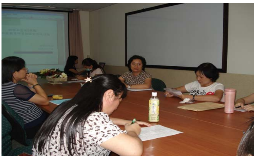
護理二技-導師研討